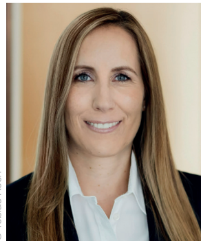
Astrid Wallmann Präsidentin des Hessischen Landtages

am 8. Oktober 2023 wählen die Bürgerinnen und Bürger in Hessen einen neuen Landtag. Die anstehende Wahl bietet die Gelegenheit, den jungen Menschen unseres